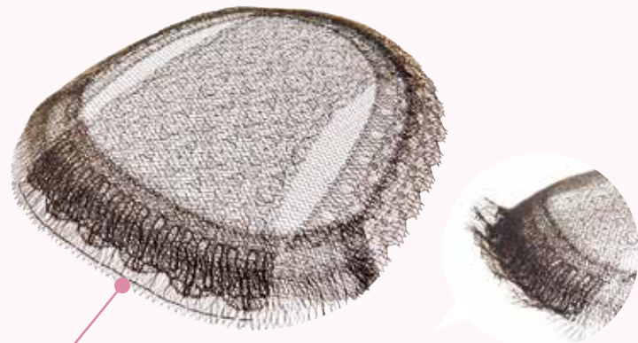
前髪LASHフロント (前髪のアップ&ダウンが簡単)