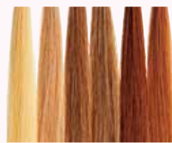
充実のデザインカラー (髪の立体感を楽しめる)

自毛ではなかなか挑戦しにくいヘア カラーのおしゃれをもっとウィッグで 自由自在に楽しめます。自毛の色を 生かしながら立体感のあるヘアス タイルに!