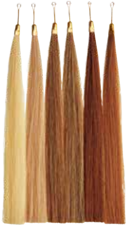
※実際の色とは異なる場合があります。